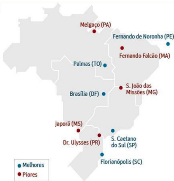
Figura 7 - Editoria de Arte/Folhapress 15